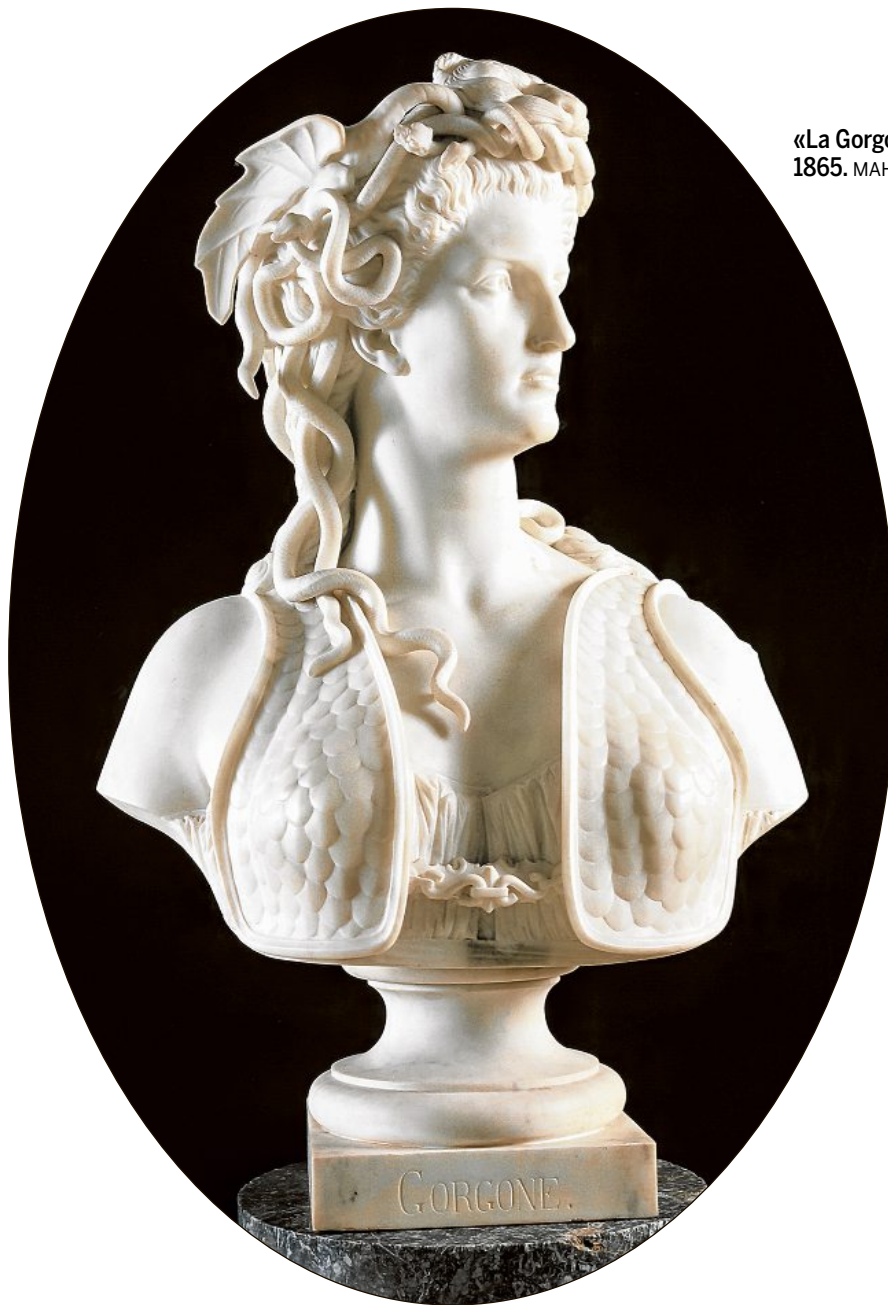
«La Gorgone» de Marcello en 1865. MAHF PRIMULA BOSSHARD

> Je 27, ve 28 novembre , colloque «L'autre Marcello», ouvert à tous, avec conférences, spectacle et concert. Université et MAHF. Programme et horaires sur lettres.unifr.ch/fr/langues-litteratures/francais.html