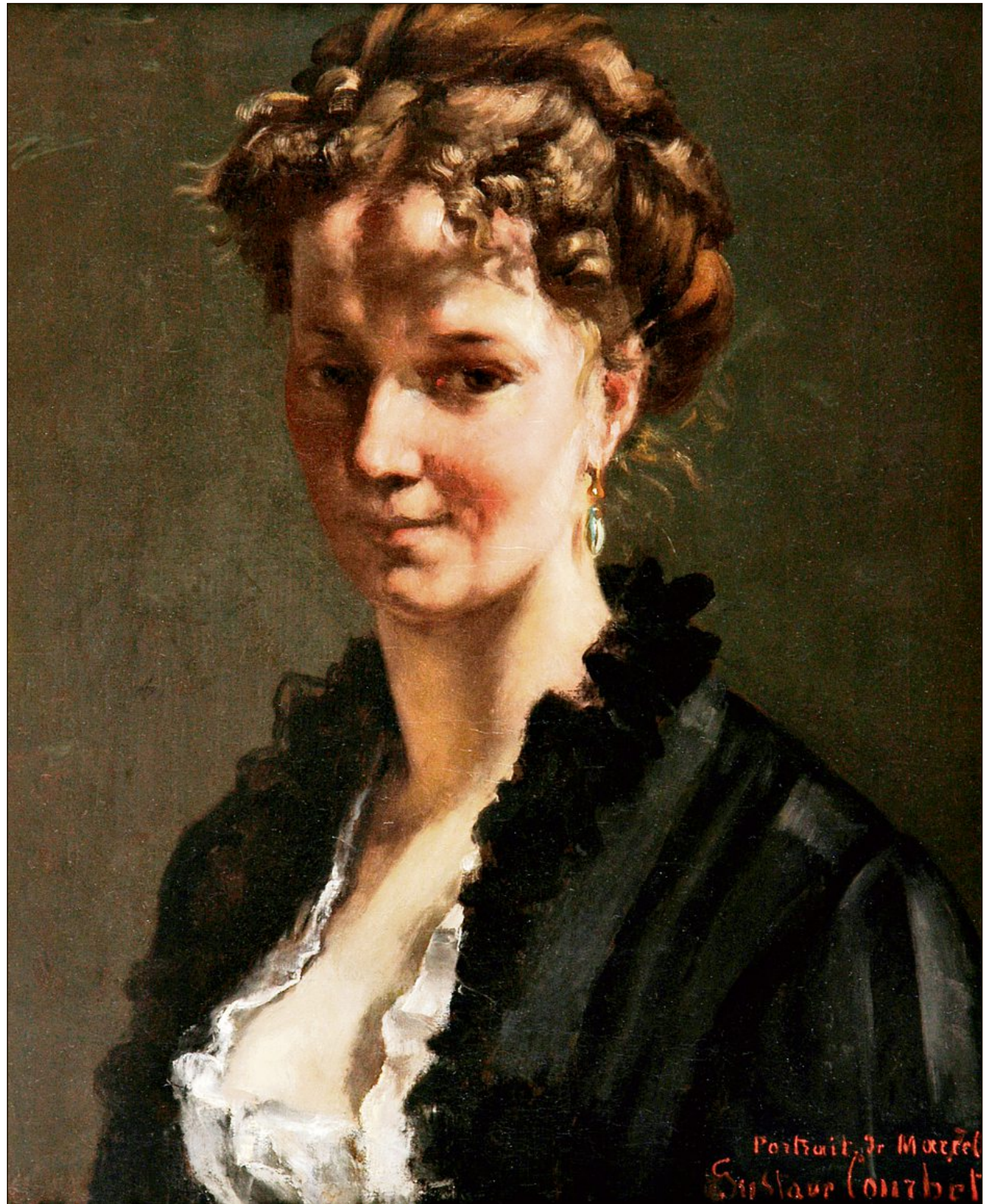
A Givisiez, sur la tombe d'Adèle d'Affry (portraiture ici par Gustave Courbet en 1870), sont gravés les mots suivants: «Elle aime le beau et le bien et ses œuvres lui survivent.»